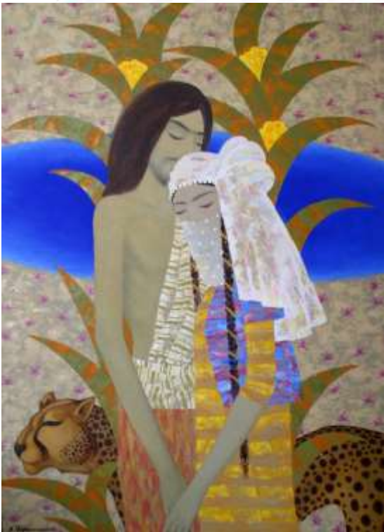
Uchrashuv (Layli va Majnun)