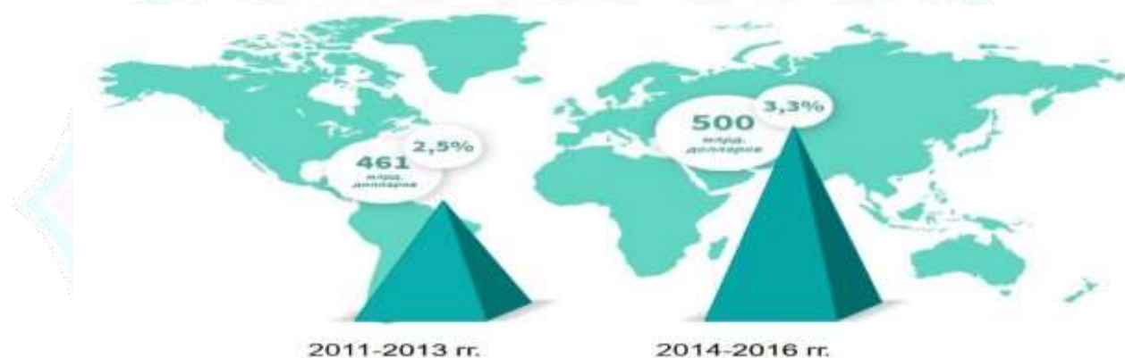
График 1. Объем контрафактной продукции в мире в 2011 – 2016 гг.

Проведенный анализ показал, что лидерами по производству контрафактных товаров являются Китай – свыше 60%, Турция – свыше 3,5% и Сингапур – свыше 2%. Чаще всего подделывались одежда, обувь, приборы и оборудование, часы, парфюмерия и косметика, игрушки. Наиболее популярным способом транспортировки контрафактных товаров являются почтовые отправления (57%).