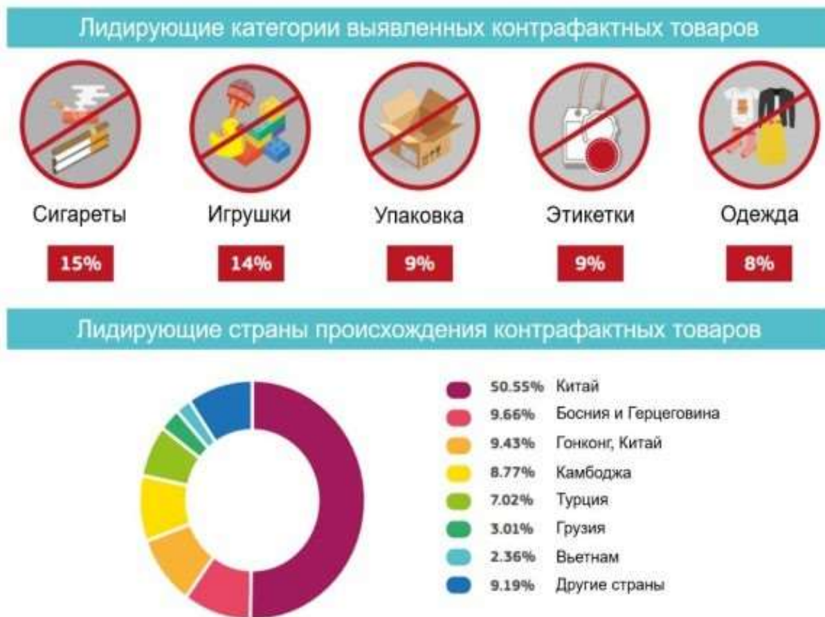
Рис. 2 Лидирующие категории выявленных контрафактных товаров и страны их происхождения

На фоне результатов исследования ОЭСР мирового рынка контрафактной продукции, в качестве итогов которого отмечалось увеличение мировых масштабов распространения контрафактной продукции и вероятный рост таких объемов в будущем, в Европейском союзе наблюдается снижение объемов контрафакта на протяжении последних отчетных периодов. Так, с 2016 года уровень контрафакта на территории Европейского союза снизился на 35% к концу 2018 года. Проведенные исследования показывают, что торговые маршруты контрафакта очень сложны. Миграция контрафактной продукции, как правило, происходит по сложным маршрутам с использованием промежуточных транзитных пунктов.