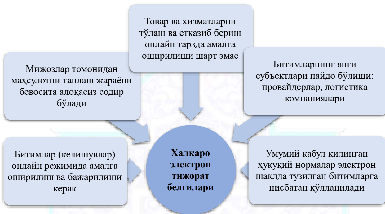
1-расм. Халқаро электрон тижоратнинг белгилари.

2-расмда халқаро электрон тижоратнинг асосий турлари кўрсатилган.