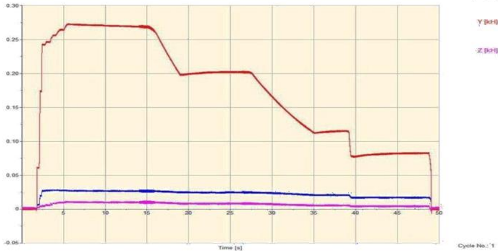
Рис. 3. График проверки силы

На графике (рис. 3) выполнена проверочная замерка с помощью динамометра. Давление выбиралось в зависимости от необходимого усилия. Сначала в систему был закачан воздух. Затем запускали процесс измерения и постепенно через определенные промежутки времени выпускали воздух из ресивера.