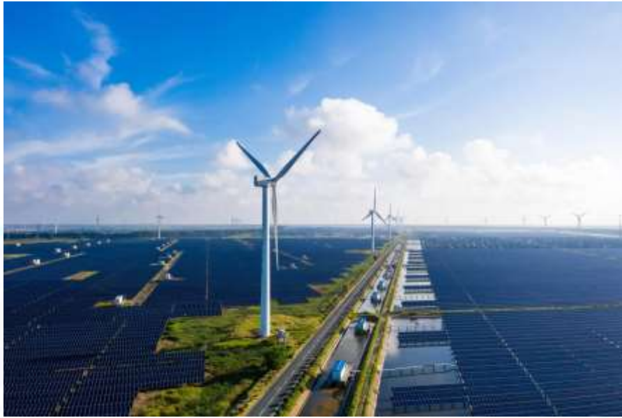
2-rasm Quyosh hamda shamol elektrostansiyasi

resurslar o'rniga metan, vodorod kabi samaraliroq manbalardan foydalanish kerak [3,4].