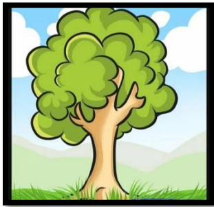
1-rasm “Sehri daraxt” didaktik o’yini chizmasi

Bu didaktik o'yindan o'tilgan mavzuni takrorlashda ,shuningdek yangi mavzu bayonidan so'ng mustahkamlash maqsadida foydalanish mumkin.Bunda doskaga yoki vatmn qog'ozga daraxt rasmi chiziladi va unga mavzu bo'yicha tayyorlab kelingan savollar yozilgan meva shaklidagi stikerlar yopishtiriladi. Bu didaktik o'yindan o'quvchilarni guruhlarga bo'lib yoki individual tarzda foydalanish mumkin.Bu didaktik o'yin o'quvchilar diqqatini dars jarayoniga jalb qilishga va mavzuga bo'lgan qiziqishini orttirishga yordam beradi.