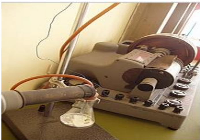
1-Rasm. laboratoriya tadqiqotrida polyarografiya usulining ko'rinishi.

Polyarografik usul (volt-ampereometrik) – tekshirilayotgan eritmada joylashgan yacheykaga mahkamlangan elektrodlardan o'tadigan tokning kuchlanishga (potensial) bog'liqligini o'rganishdan iborat. Potensiallar qiymati odatda voltning bir necha o'ndan bir qismidagi manfiy qiymatdan taxminan ikki voltlik musbat qiymatigacha bo'lgan diapozinda o'zgarib turadi [2].