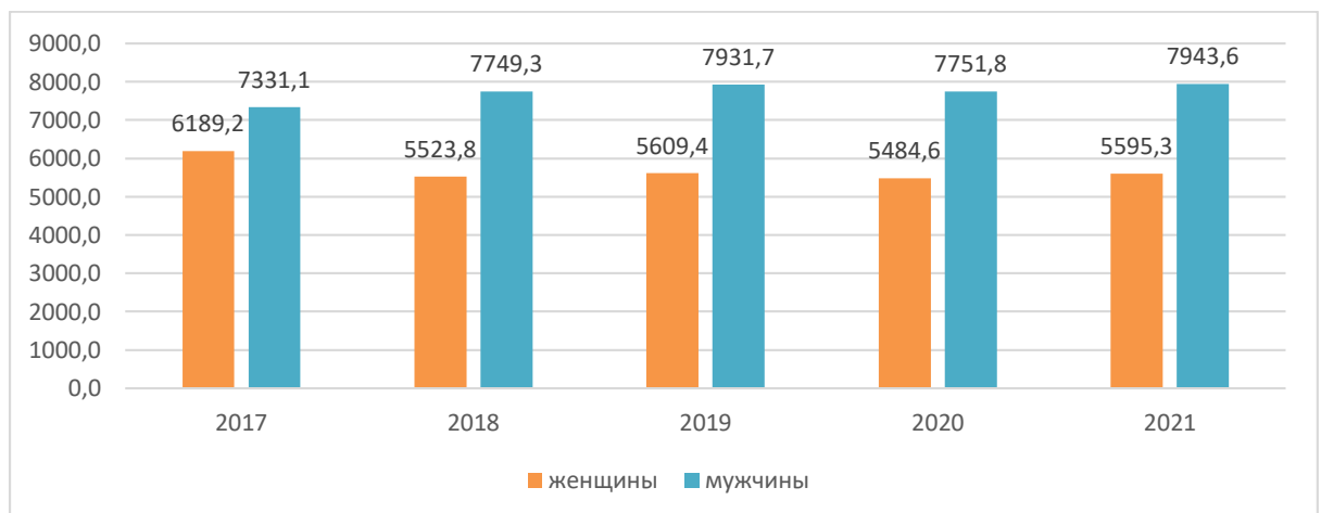
Рис.1. Гендерно-дезагрегированные данные занятых в экономике Узбекистана, тысяч человек

Однако анализ численности гендерно-дезагрегированных данных, занятых в экономике, представленных Государственным Комитетом Статистики с 2017 по 2021, демонстрирует значительный разрыв между занятостью женщин и мужчин. Численность занятых женщин за последние пять лет постепенно снижалась с 6189,2 в 2017 году до 5595,3 в 2021. В 2021 году этот гендерный разрыв составил 2348,3 женщин, что почти в два раза больше, чем в 2017 году, когда идентичный показатель составил 1141,9 работниц (рис.1). 5