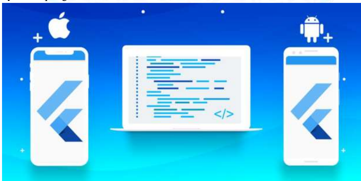
3-rasm. Flutterda iOS hamda Andoroid uchun mobil ilovalar yaratish mumkin.

Flutter - bu Google tomonidan yaratilgan ochiq manbali UI dasturiy ta'minot ishlab chiqish tizimi. U Android, iOS, Linux, macOS, Windows, Google Fuchsia, va Internet uchun yagona kod bazasidan o'zaro platforma ilovalarini ishlab chiqishda foydalaniladi. Birinchi marta 2015-yilda ishlab chiqilgan. Flutter 2017-yilning may oyida chiqarilgan.