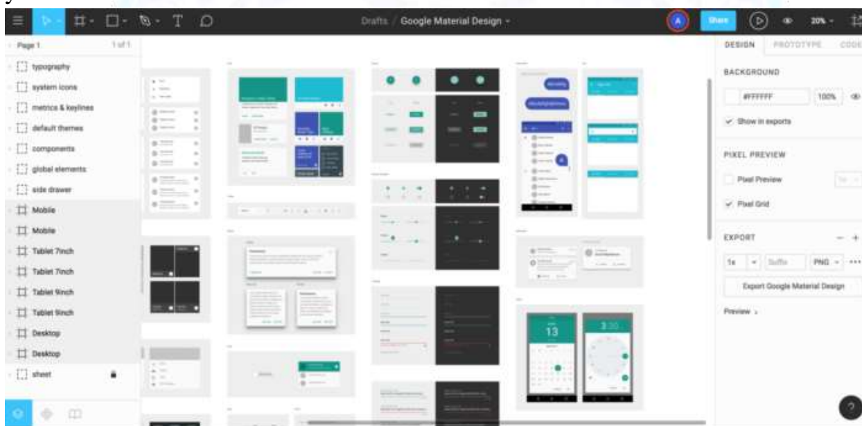
4-rasm. Figma dasturida UI ko‘rinishini yaratish.

Figma - vektor grafik muharriri va prototiplash vositasi bo‘lib, u asosan veb-ga asoslangan bo‘lib, macOS va Windows uchun ish stoli ilovalari tomonidan yoqilgan qo‘shimcha oflayn funksiyalarga ega. Android va iOS uchun Figma mobil ilovasi real vaqtda mobil qurilmalarda Figma prototiplarini ko‘rish va ular bilan ishlash imkonini beradi. Figma xususiyatlari to‘plami foydalanuvchi interfeysi va foydalanuvchi tajribasini loyihalashda foydalanishga qaratilgan bo‘lib, real vaqtda hamkorlikka urg‘u beradi. Mustaqil MacOS ilovasi sifatida ishlaydigan Sketchdan farqli o‘laroq, Figma butunlay brauzerga asoslangan va shuning uchun nafaqat Mac kompyuterlarida, balki Windows yoki Linux bilan ishlaydigan shaxsiy kompyuterlarda va hatto Chromebooklarda ham ishlaydi. Shuningdek, u veb-API ni taklif qiladi va u bepul. Figmaning yana bir katta afzalligi shundaki, u bir xil faylda real vaqtda ishlash imkonini beradi. Sketch va Photoshop kabi an'anaviy "oflayn" ilovalardan foydalanganda, agar dizaynerlar o‘z ishlarini baham ko‘rishni xohlasalar, odatda uni rasm fayliga eksport qilishlari kerak, keyin uni elektron pochta yoki tezkor xabar orqali yuborishlari kerak.