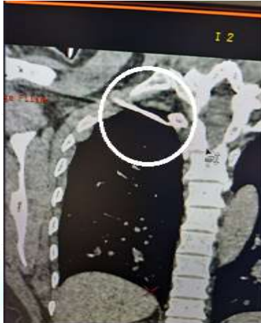
1-rasm. Bemor ko'krak qafasi rentgenogrammasi. Yot jism o'ng pleval bo'shlig'iga

Bemorga quyidagi tashxis qo'yildi: O'ng pleval bo'shliqdagi begona jism. osteosintez operatsiyasidan (2013 yil) va chap klavikulaning spitsasini olib tashlashdan keyingi holat(2014 yil).