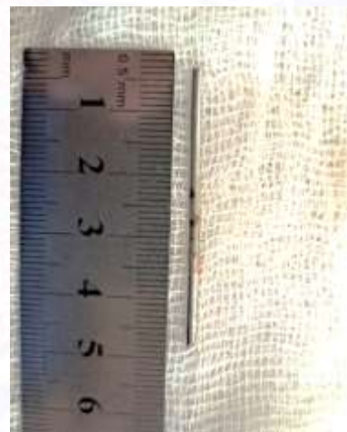
Puc. 4. Udalennoe inorodnoye telo.

17.01.2018 yilda bemorga operatsiya o'tkazildi: migratsiya qilgan Kirshner spitsasining qismi videotorakoskopik yo'l bilan olib tashlandi (rasm 2, 3). Ushbu qism 5 sm uzunlikda bo'lib, 1/3 qismi mediastinda mediastinal pleval ostida, va 1/3 qismi yuzaki ravishda o'ng o'pka to'qimasiga, visseral pleval ostiga kirib ketgan. Migratsiya qilgan Kirshner spitsasining qismi kesish chizig'i bo'ylab joylashgan va yuqoridan pastga, olddan orqaga, orqa mediastindan o'ng pleval bo'shliqqa, oziq-ovqat borusi va katta venaning orasidan (katta venadan 0,5 sm yuqorida) o'tgan. O'ng mediastindagi mediastinal pleval kesilgan, spitsaning distal uchi mobilizatsiya qilinib, keyin pens bilan ushlab olinib olib tashlandi. Operatsiya pleval bo'shliqni Byulau usuli bilan drenaj qilish bilan yakunlandi.