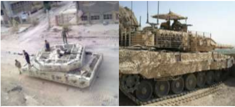
4-rasm. Tanklarga o‘rnatilgan qo‘shimcha himoya vositalari.

samarali foydalanishda, ularning yashovchanligini oshirish orqali erishish muhim hisoblanmoqda.