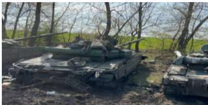
1-rasm. Urushning boshlang‘ich fazasidagi tankning ko‘rinishi.

To‘qnashuvlarning boshlang‘ich fazasida dastlabki qabul qilingan qarorlarda kuch va vositalarning ko‘rinishi, jihozlanishi, qo‘llanilishi hattoki taktik harakatlarning usullari janglarning faol fazasida shakl va usullarining o‘zgarishiga olib kelmoqda [1, 2]. Yaqin misol sifatida, Yaqin sharq yoki Rossiya va Ukrainiya harbiy mojarosida tanklarning tashqi tomondan jihozlanishi va taktik jihatdan qo‘llashning yangicha usullarini (tank devori, tank karuseli va tang yengi) joriy etilishini ko‘rish mumkin (1, 2-rasm).