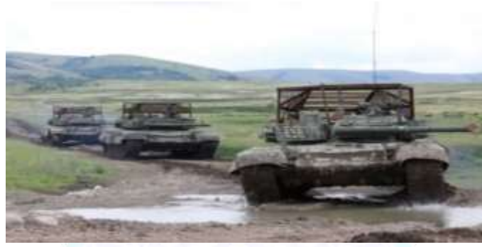
2-rasm. Urushning faol fazasidagi tanklarning ko‘rinishi.

Albatta tarixga nazar tashlasak, tanklar ikkinchi jahon urushi sahnasida dushmanning mustahkam mudofaa pozitsiyasini yorib o‘tish orqali piyoda qo‘shinlari tomonidan uni qurshab olish va yakson etish uchun sharoit yaratishda asosiy zarba kuchi sifatida foydalanilgan. Bundan tashqari qarama-qarshi tomonlarning zirhli texnikasiga qarshi kurashish vositasi sifatida qabul qilingan. Keyinchalik tankka qarshi boshqariladigan raketalar va qo‘l granatomyotlarning paydo bo‘lishi natijasida tanklarning dushman mudofaasini yorib o‘tish vazifasidan biroz voz kechildi, uning o‘rniga taktik aviatsiyaning rivojlanishi ushbu vositalarning o‘rniga qo‘llana boshladi. Tankka qarshi vositalarning takomillashishi natijasida, tankka qarshi granatalar kabi uning oldiga yaqinlashmasdan, uzoq masofadan talafot yetkazish qudratiga ega bo‘lishdi. Ushbu vositalarning paydo bo‘lishi va tanklarning yakson etilishining ortishi ortida ham zirhli texnikalardan voz kechilmadi, aksincha uni himoyalash hamda yashovchanligini oshirishning usullari joriy etila boshlandi [3, 4]. Demak, bugunning rivojlangan texnikalari, xususan tankka qarshi vositalarning rivojlanishi yoki uchuvchisiz uchish apparatlariga nishon bo‘lishi tanklarni jangovar harakatlar maydonidan, qurollanishdan olib tashlash kerak degani emas.